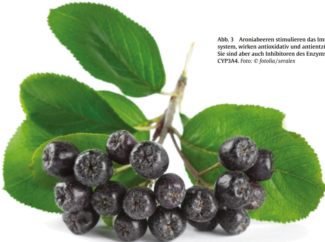
Abb. 3 Aroniabeeren stimulieren das Immunsystem, wirken antioxidativ und antientzündlich. Sie sind aber auch Inhibitoren des Enzyms CYP3A4.

Enzyminhibition von CYP3A4, das für den Stoffwechsel beider Substanzen notwendig ist (Induktion/ Stimulation). Somit kommt es zu Wirkungsverlust (Inhibition/ Hemmung) und in der Folge zu Wirkungsverstärkung.