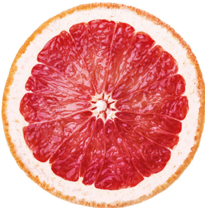
Abb. 2 Grapefruitsaft hemmt CYP3A4. Werden bestimmte Medikamente, wie Zytostatika, gleichzeitig eingenommen, kann deren Bioverfügbarkeit erhöht sein, da die Regulierung durch das Enzym entfällt.